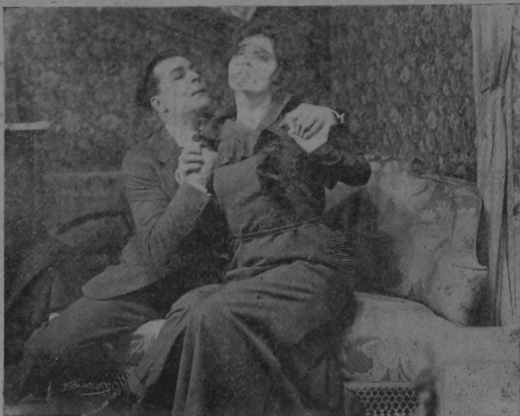
Interpretada por la bella María Jacobini, obra de arte monumental